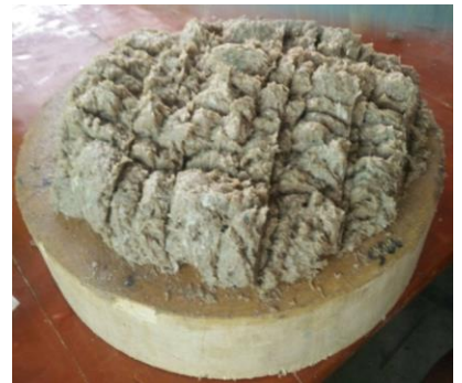
ภาพการทำปลาร้าสับ