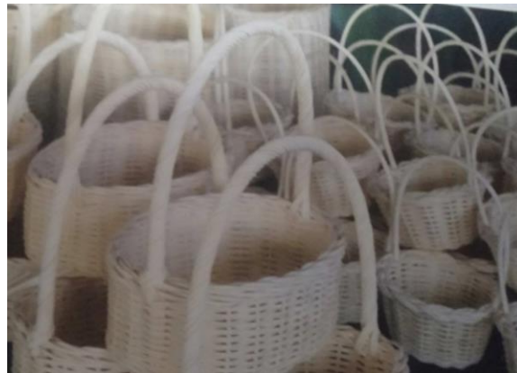
ภาพผลิตภัณฑ์จากหวาย