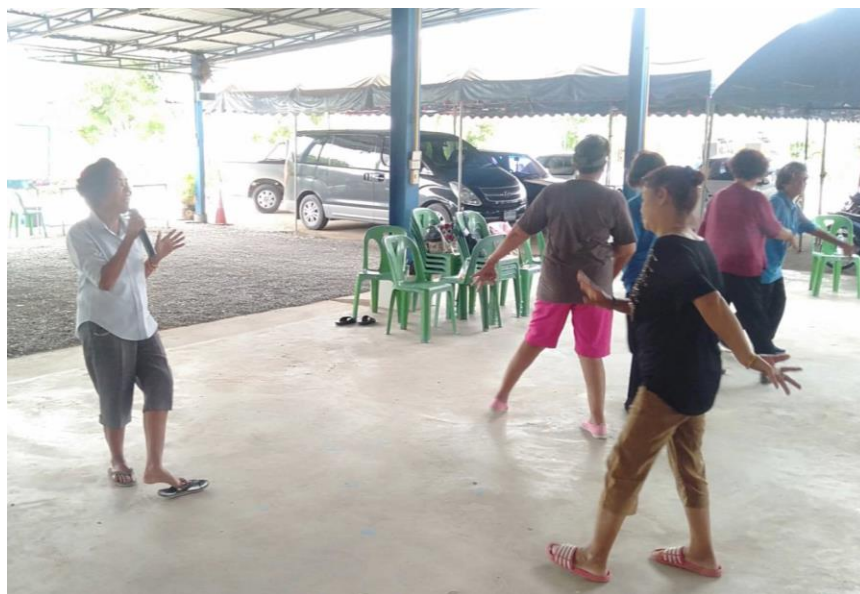
ภาพการขับร้องเพลงร่ำวงราชสถิตย์