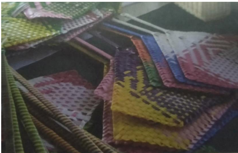
ภาพผลิตภัณฑ์จักสาน